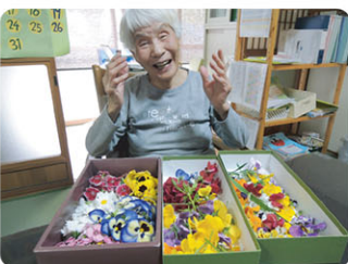
初夏の日差しを浴び、 元気に咲く花たちに感謝して、押し花アートを みんなで作成しました。 彩りあふれる素敵な作品が和ごころに咲きました。