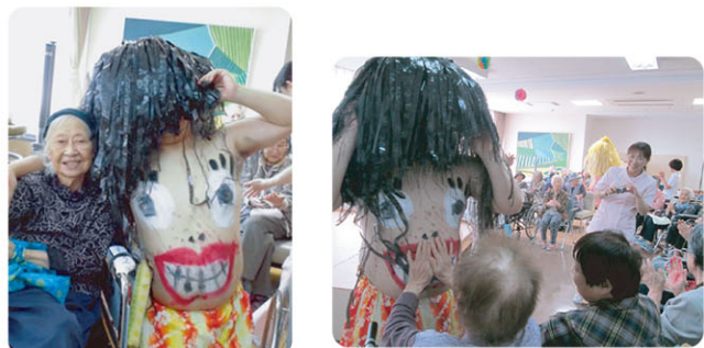
くねくね動く立派なおなか！ お誕生会は大爆笑でした♪