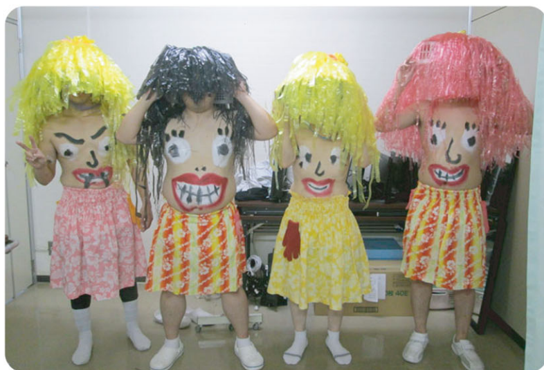
体を張った松恒園男性スタッフたち。「利用者さんのためならもう一肌！」「いえいえ、これ以上はけっこうです…。」