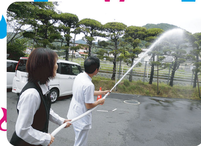
5月末~6月にかけて、防災訓練を実施しました。職員全員が消火器、ホースにて消火活動を体験しました。いつ、何が起きるかわかりません…備えは万全に！！