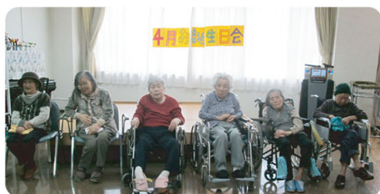
お誕生日を迎えられた皆様、 おめでとうございます！