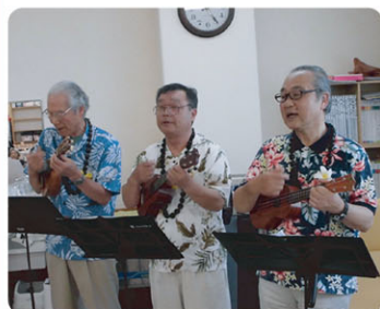
メレアロハさん(門司区) メケアロハさん(小倉南区)