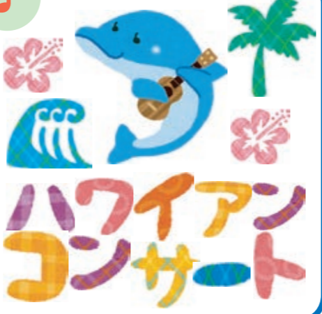
和ごころ & 通所リハに、メケアロハ様、登場！心地よいウクレレの音色がさわやかなハワイの景色を連想させます♪