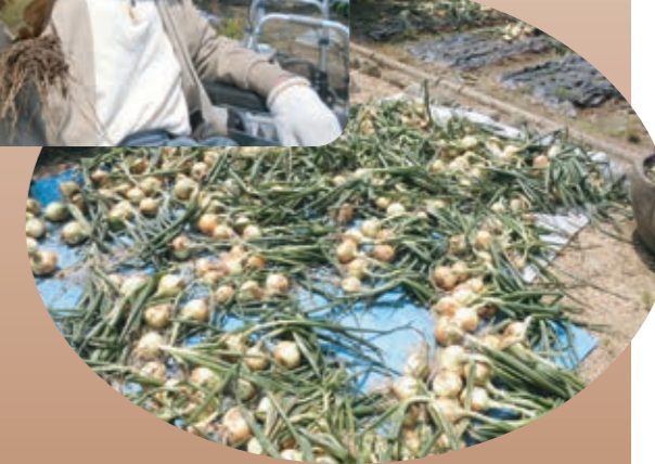
笑顔も玉ねぎも、今年は豊作！豊作！！