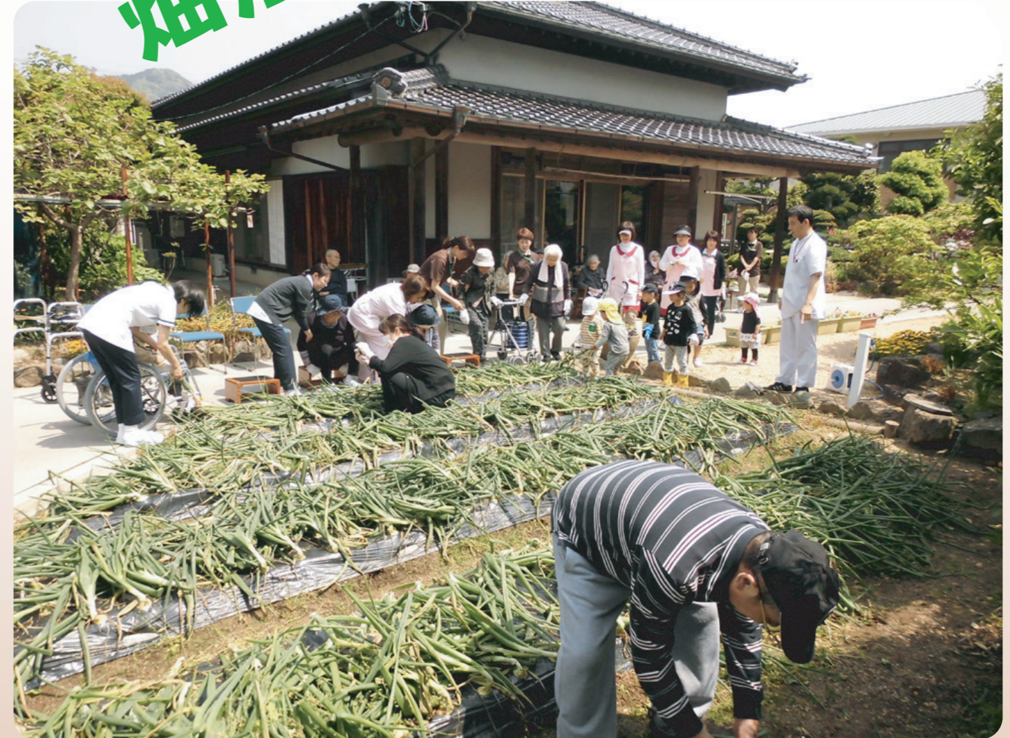
和ごころ庭園の畑で農作業！今回は玉ねぎの収穫です。作物が育ったときに、各事業所の利用者さん、ひだまりキッズが集います。土や日光に触れ、自然の恵みを皆で喜び、楽しい交流の場となっています♪