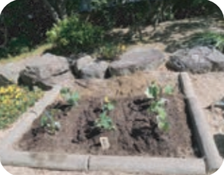
庭の一角にきゅうりを植えました。夏に向けて成長をみんなで見守ります！楽しみです♪