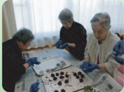
5月の和スイーツ代表格！あんを丸めて甘〜く美味しく出来上がりました！