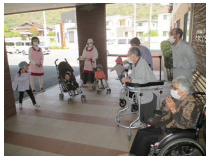
開設10年を迎えたたなごころ。コロナにより、1周年、5周年のようなイベントは出来ませんでした。ひだまりキッズとの交流、趣味の時間、訪問販売など、のんびり楽しいホーム生活です♪