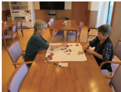
開設当初★自由なホーム生活。気の合う仲間と花札対決！