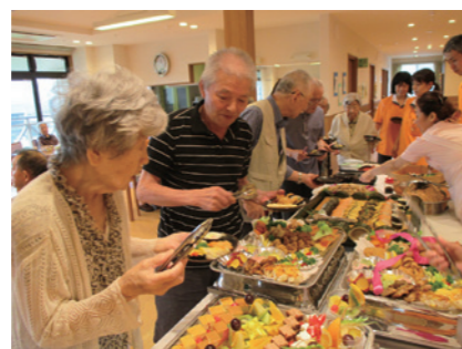
開設1周年★ご家族さまを招いてランチバイキング！おいし♡