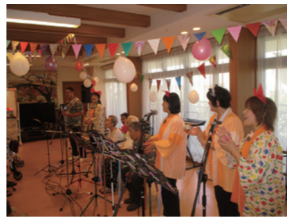
開設5周年★職員がバンドを組んで生演奏しました♪